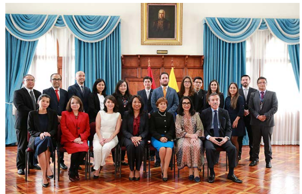
Delegaciones de Ecuador e Indonesia

Las dos Delegaciones reafirmaron su determinación de profundizar las excelentes relaciones de amistad entre los dos países y expresaron su complacencia por la exitosa realización de la I Reunión del Grupo de Trabajo en Comercio e Inversiones entre ambos países.