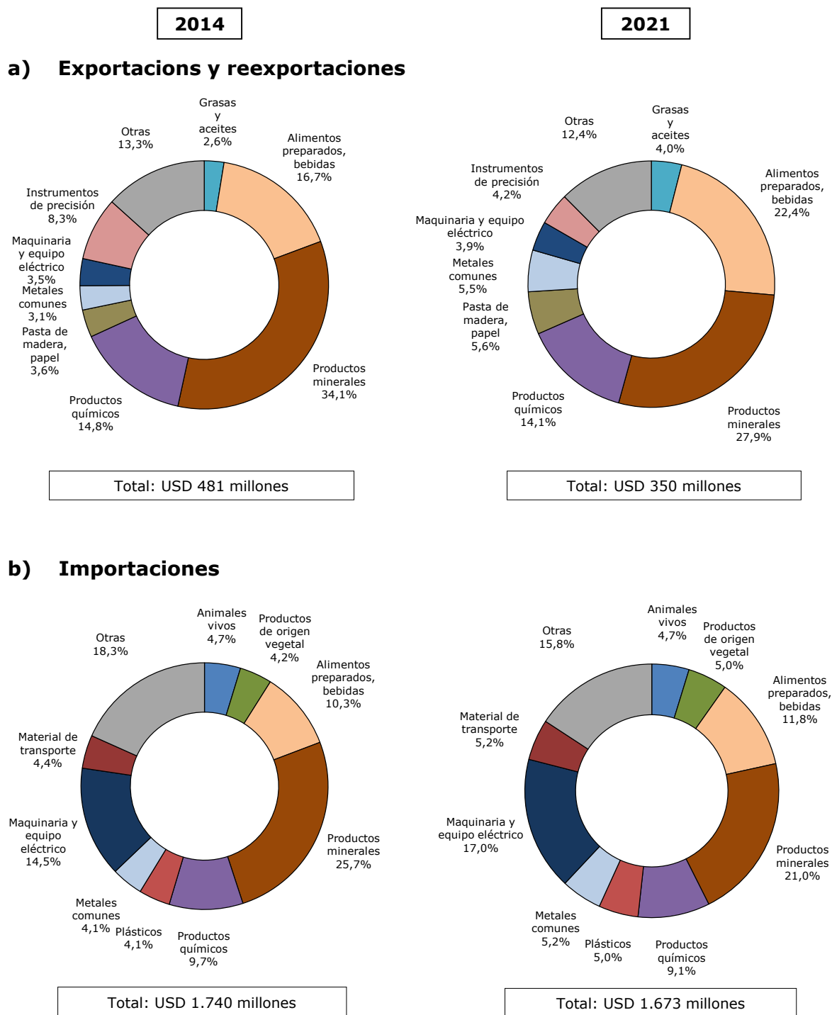
Gráfico 1.1 Comercio de mercancías por principales Secciones del SA, 2014 y 2021