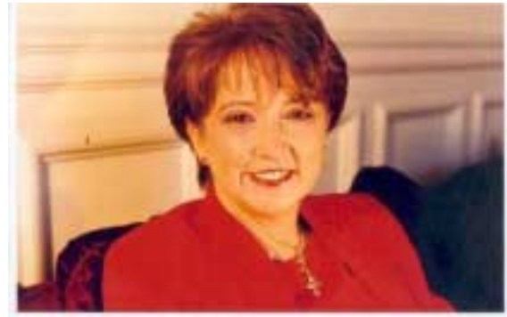
María Soledad Alvear V. Ministra de Relaciones Exteriores