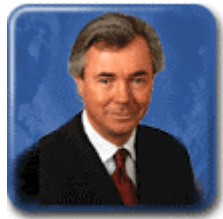
Pierre S. Pettigrew Ministro de Comercio Internacional

Chile: http://www.direcon.cl/frame/acuerdos_internacionales/f_bilaterales.html