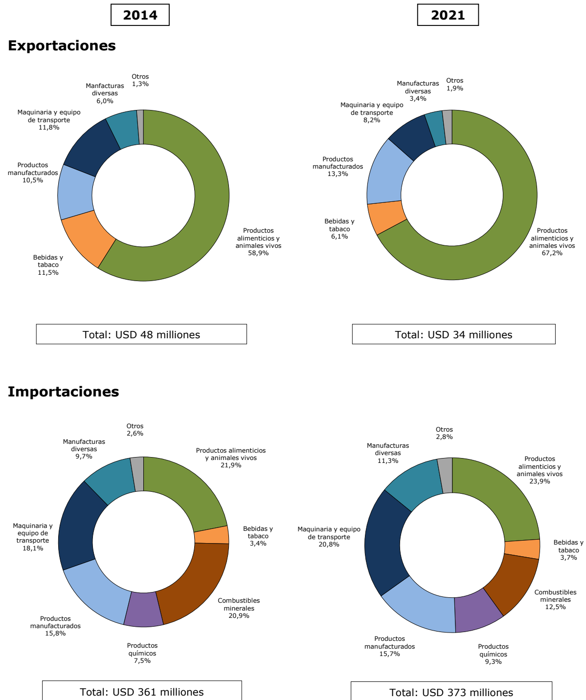
Gráfico 1.1 Comercio de mercancías por principales secciones de la Clasificación Uniforme para el Comercio Internacional (CUCI), 2014 y 2021