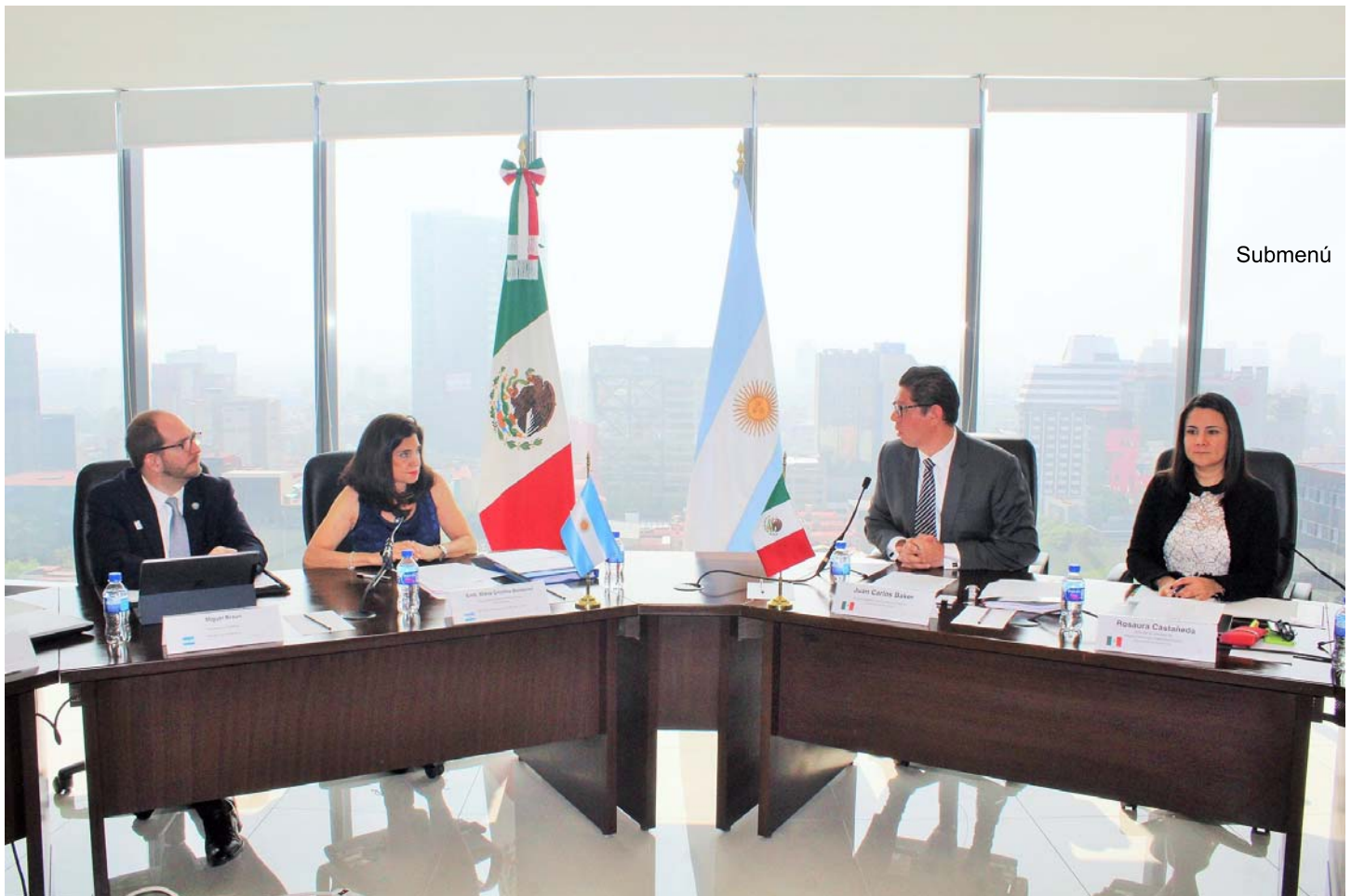
México y Argentina realizaron la Primera Ronda de Negociaciones para Ampliar y Profundizar el Acuerdo de Complementación Económica